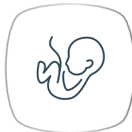
ค่าคลอดบุตร (2)