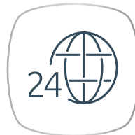
คุ้มครองทุกพื้นที่ ทั่วโลก 24 ชั่วโมง

• อายุรับประกันภัย 11-80 ปี (คุ้มครองสูงสุดถึงอายุ 99 ปี) (3)