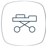
การรักษาพยาบาล แบบฉุกเฉิน