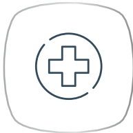
คุ้มครอง ผู้ป่วยนอก (OPD) (1)