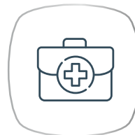
การรักษาพยาบาล อื่นๆ