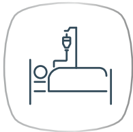
คุ้มครอง ผู้ป่วยใน (IPD)